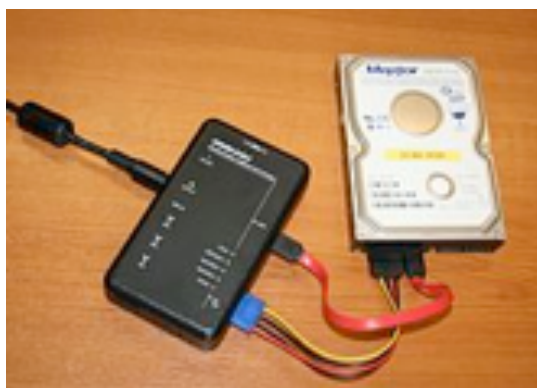
Figura 2 - Write blocker