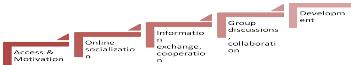
Fig. 1 – Stadi della progettazione di OOC

Development: il discente è artefice del proprio apprendimento.